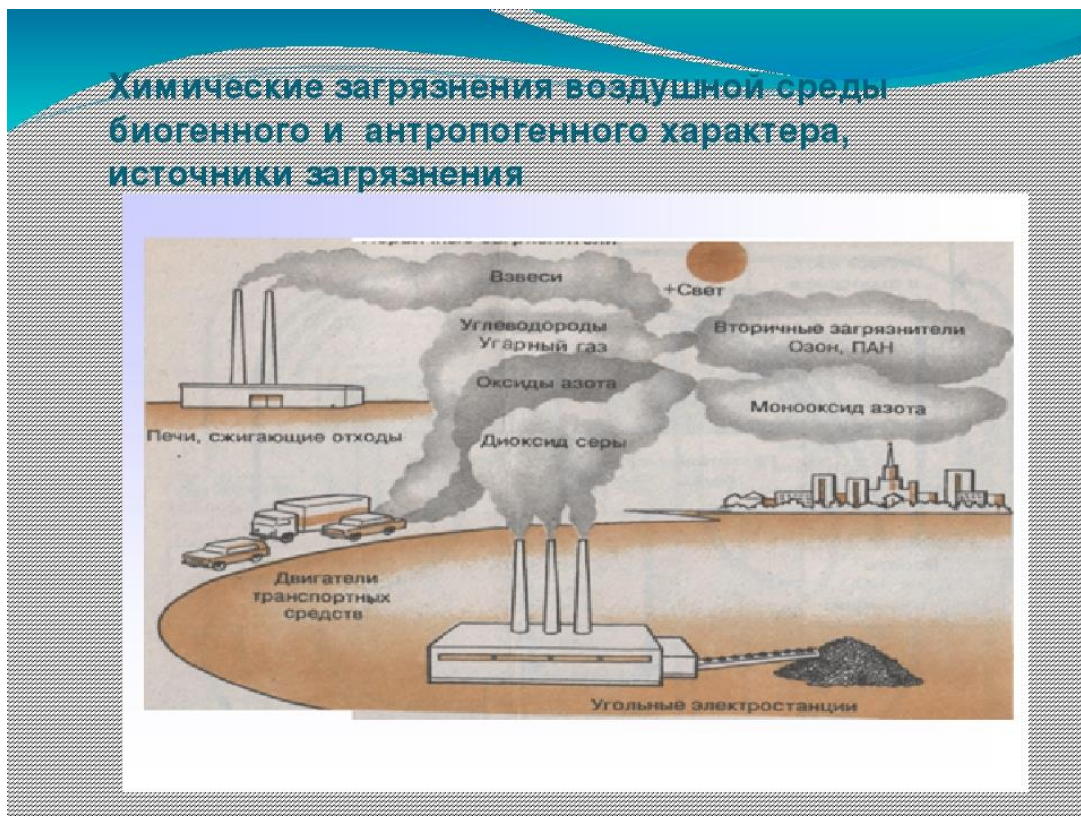
Рисунок 3 - Источники загрязнения воздушной среды

Известно [5, 9], что общий объем валовых выбросов при строительстве одной скважины составляет 88,88 тонн. При этом доля веществ первого (I) класса опасности составляет менее 0,001%, второго (II) класса опасности – 0,51%, для веществ третьего (III) класса опасности – 43,22% и, наконец, для веществ четвертого (IV) класса опасности – 56,27%. Таким образом, при бурении скважин воздушная среда загрязняется веществами, которые относятся к III и IV классов опасности. При этом к числу приоритетных загрязняющих веществ относятся оксид углерода, углеводород и сажа, выбросы которых составляют соответственно 1336, 207 и 158 т/год.