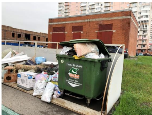
Рисунок 1 - Отходы ППС на контейнерной площадке

В России по данным открытых публикаций не найдено информации об использовании техники компактирования ППС кроме обычной ручной укладки при погрузке в мешки или кузов автомобиля. Анализ российских публикаций показал, что переработка отходов ППС осуществляется в очень небольших количествах (20 % от общего производства). На сайте Ассоциации производителей и поставщиков пенополистирола (см. «Ассоциация производителей и поставщиков пенополистирола. [Электронный ресурс]. - URL: https://epsrussia.ru/ (дата обращения: 22.08.21)] не найдено информации об использовании компакторов ППС, как и о проблеме его рециклинга в целом.