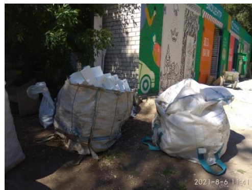
Рисунок 2 - Сбор отходов ППС волонтерами г. Самары

В России отсутствует сложившаяся практика сбора ППС. Обычные пункты приема отходов не берут ППС, так как он занимает большие площади для сбора, требует защиты от влаги, поскольку переработке поддается только сухой и очищенный пенопласт.